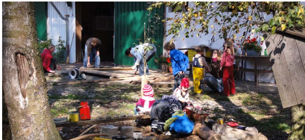
Bauernhofkindergarten Olching e.V.