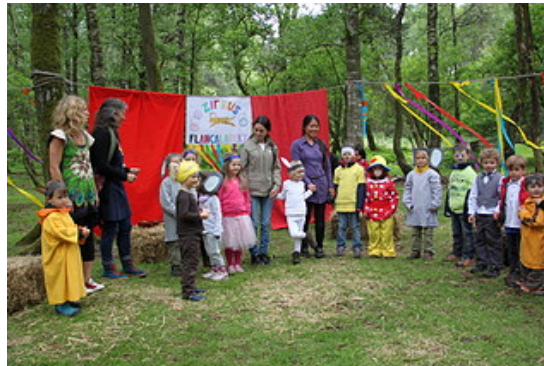
Bauernhofkindergarten Olching e.V.

Teilweise sind auch die Eltern und weiter Familienangehörige eingeladen.