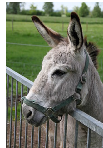
Bauernhofkindergarten Olching e.V.